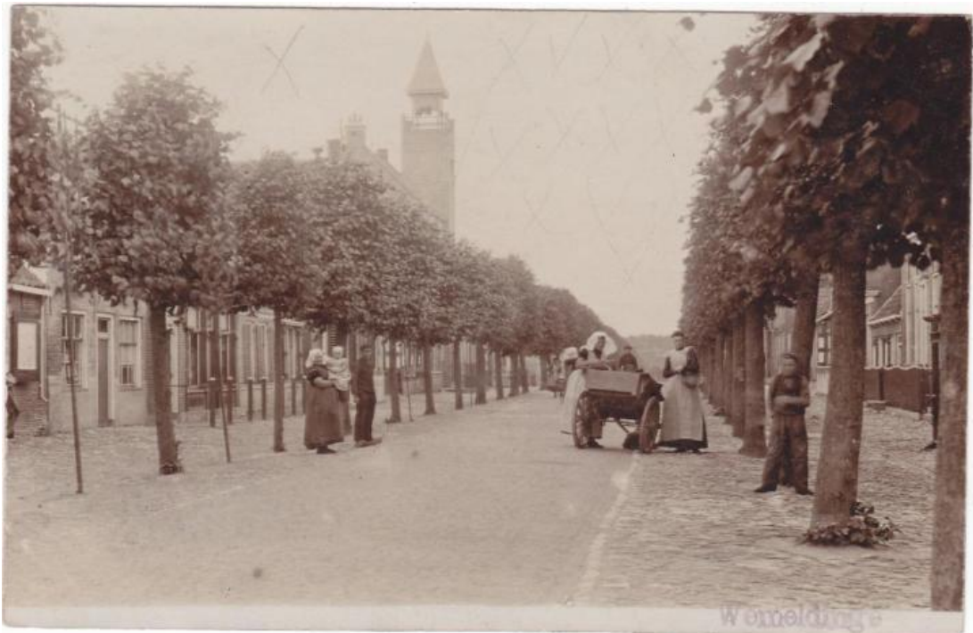
Afb.1 Dorpsstraat te Wemeldinge

De naam Wemeldinge is vermoedelijk afkomstig van de Germaanse naam Werimbald afgekort "Wimald"(moedige bewaker) met het achtervoegsel "inge". Dit laatste werd ook wel gebruikt als aanduiding van een kreek. De kerk van Wemeldinge ligt n.l. op een kreekrug. Mogelijk is Wemeldinge één der oudste parochies van Zuid Beveland.