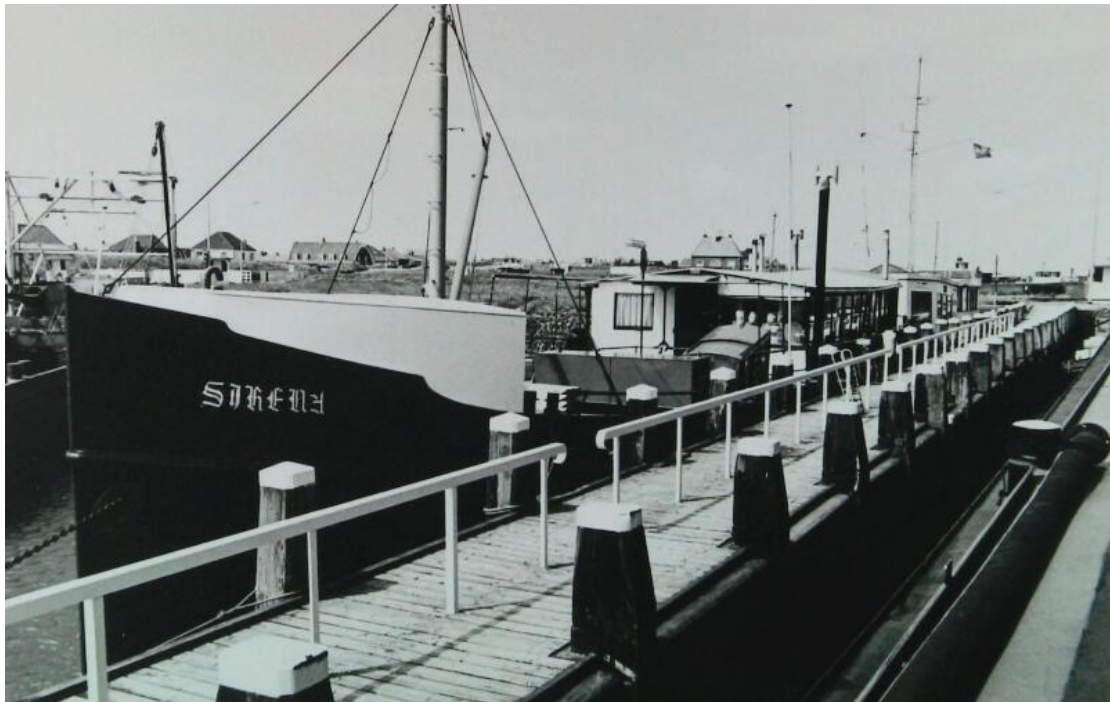
Afb.6 winkelschip "Sirena" van de fam.Lantsheer en daar achter nog zichtbaar het winkelschip van de fam.Wagenaar