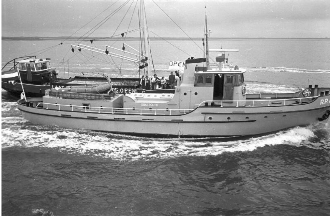
Afb. 3 de RP 18 in actie bij "Open Oosterschelde"

Een van de bekendste patrouilleboten in Wemeldinge was de RP 18. (afb. 3)