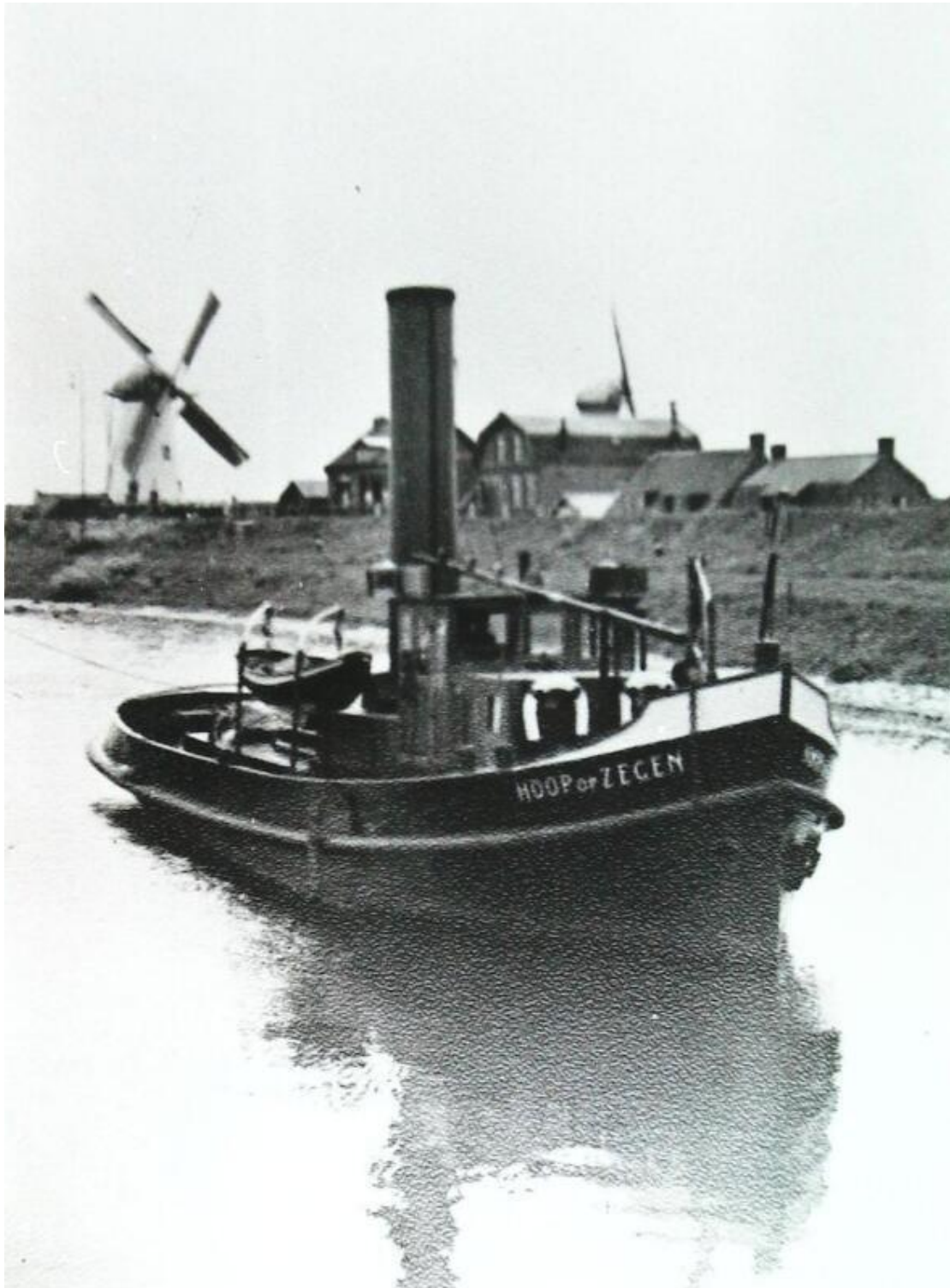
Afb. 7 sleepboot "Hoop op Zegen" van Janus Ruissen ZB/Beeldbank